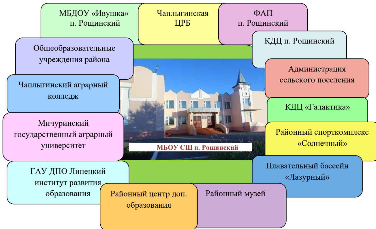
Схема взаимодействия с социальными партнерами МБОУ СШ п. Роцинский

Совместная деятельность с общеобразовательными организациями реализуется через педагогические семинары, творческие отчеты, конкурсы, тренинги. Подготовка первоклассников к школе невозможна без взаимодействия с ДОУ. В рамках профориентационной подготовки выпускников традиционными являются встречи с представителями профессиональных образовательных организаций: агроколледжа г. Чаплыгина, Мичуринского агроуниверситета и др. МБОУ СШ п. Роцинский взаимодействует с МАУ ДО «Центр дополнительного образования «Стратегия» Липецкой области по организации обучения школьников 7-10 классов по дополнительным образовательным программам в дистанционном режиме (проект «Очно-заочная школа «Одаренный ребенок»).