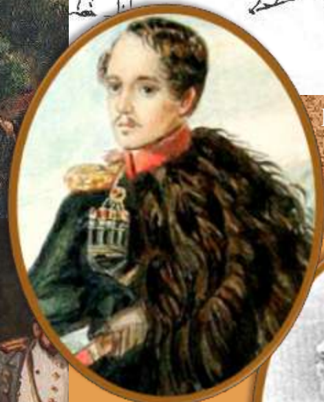
М. Ю. Лермонтов. Автопортрет. 1837 - 1838