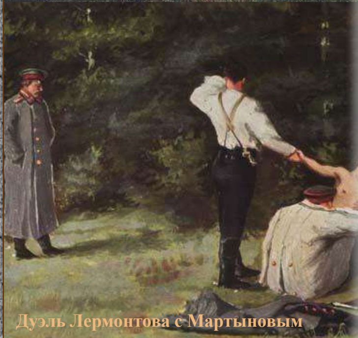
Дуэль Лермонтова с Мартыновым