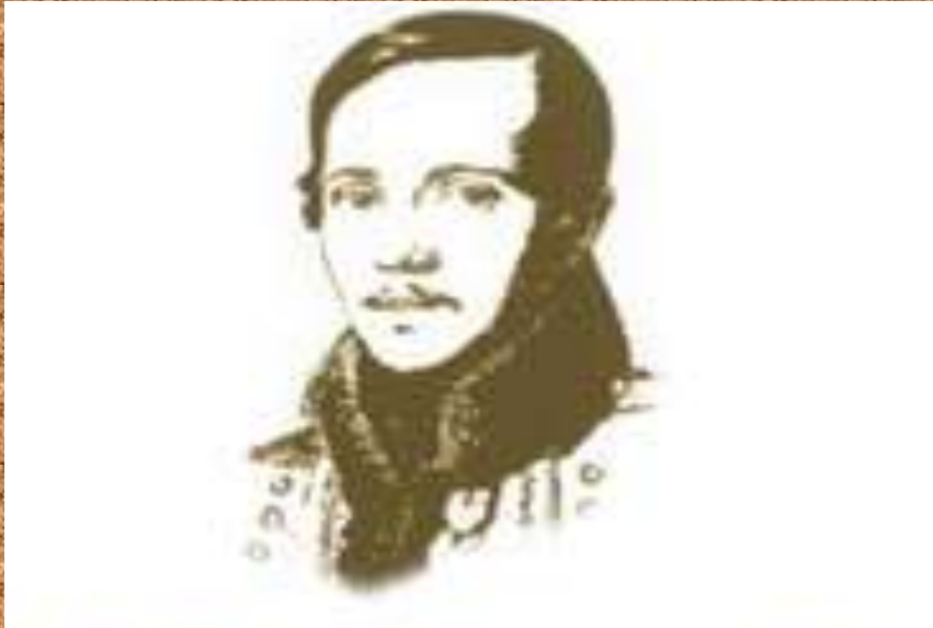
М. Ю. Лермонтов