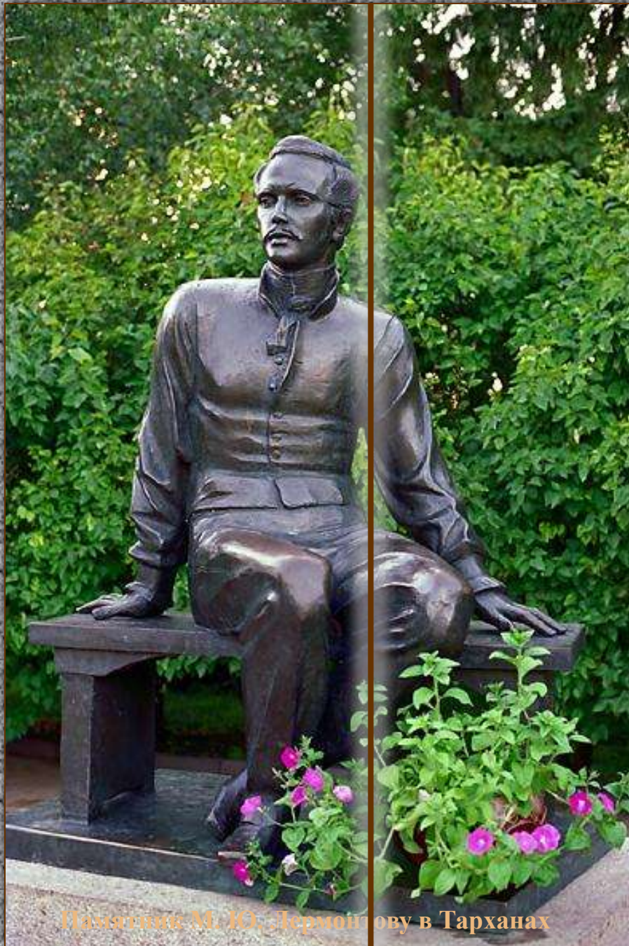
Памятник М. Ю. Лермонтову в Тарханах

Я б желал навеки так заснуть, Чтоб в груди дремали жизни силы, Чтоб, дыша, вздымалась тихо грудь; Чтоб всю ночь, весь день мой слух лелея Про любовь мне сладкий голос пел, Надо мной, чтоб, вечно зеленея, Темный дуб склонялся и шумел.