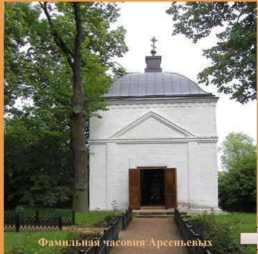
Фамильная часовня Арсеньевых